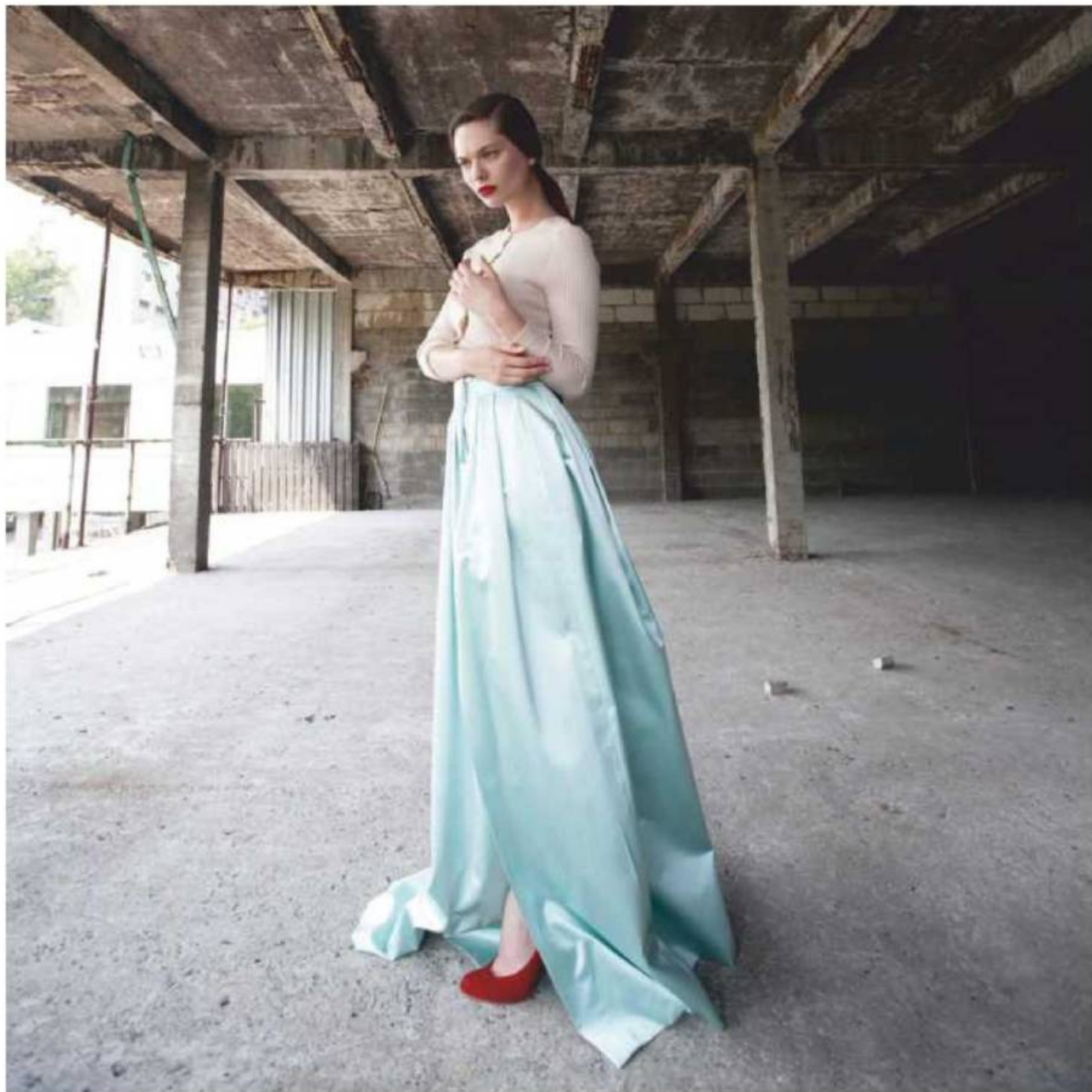
Jupe maxi fendue en satin et cardigan crème (le tout Paule Ka), escarpins en daim rouge (Christian Louboutin).