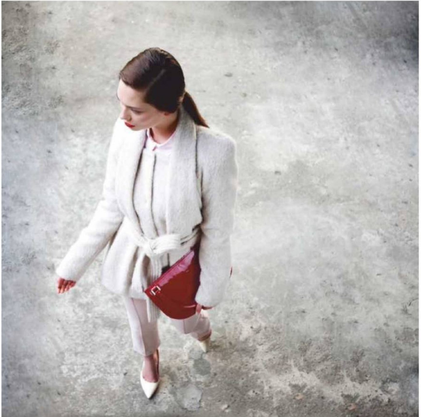
Manteau court en laine (Joanne Vanden Avenne), blouse rose transparente (By Malene Birger), pantalon trois-quarts rose pâle (Just in Case), escarpins écrus à talons dorés (Les Petites...), sac rouge en cuir laqué (Maison Martin Margiela).