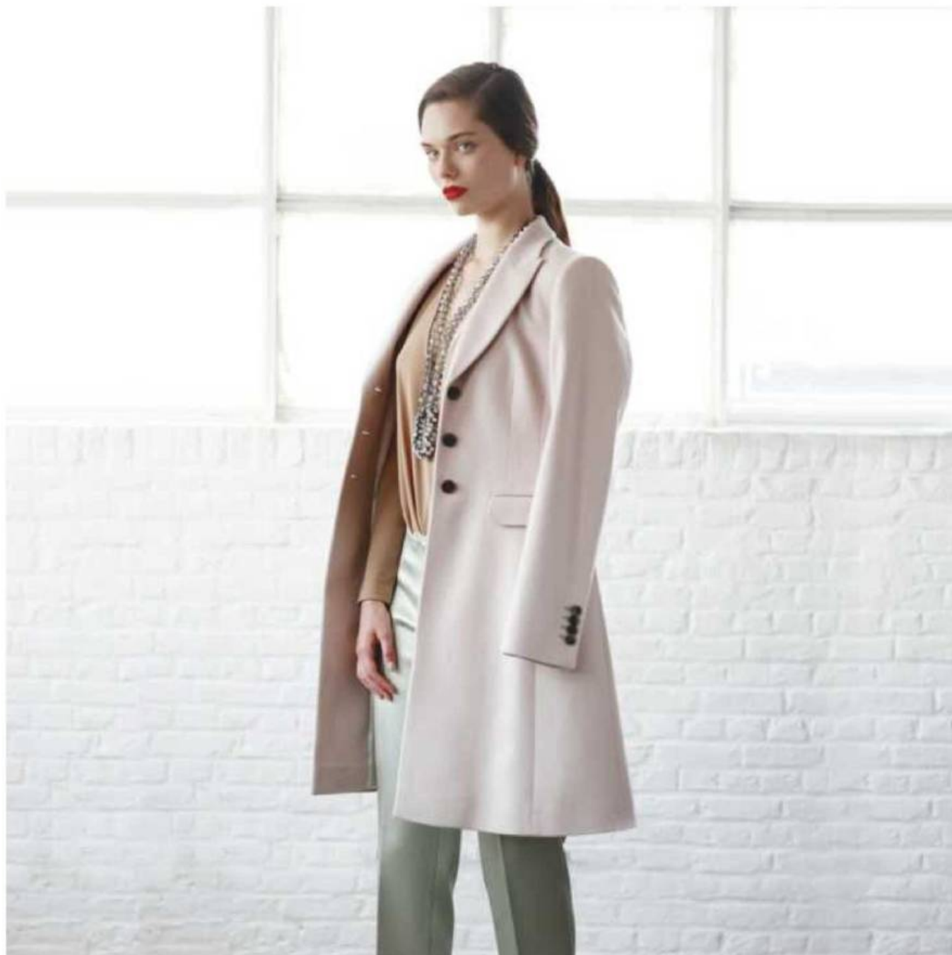
Body camel en stretch (Supertrash), collier en verre et perles de strass (Essentiel), manteau rose poudré (Hugo Boss), pantalon en satin (COS).