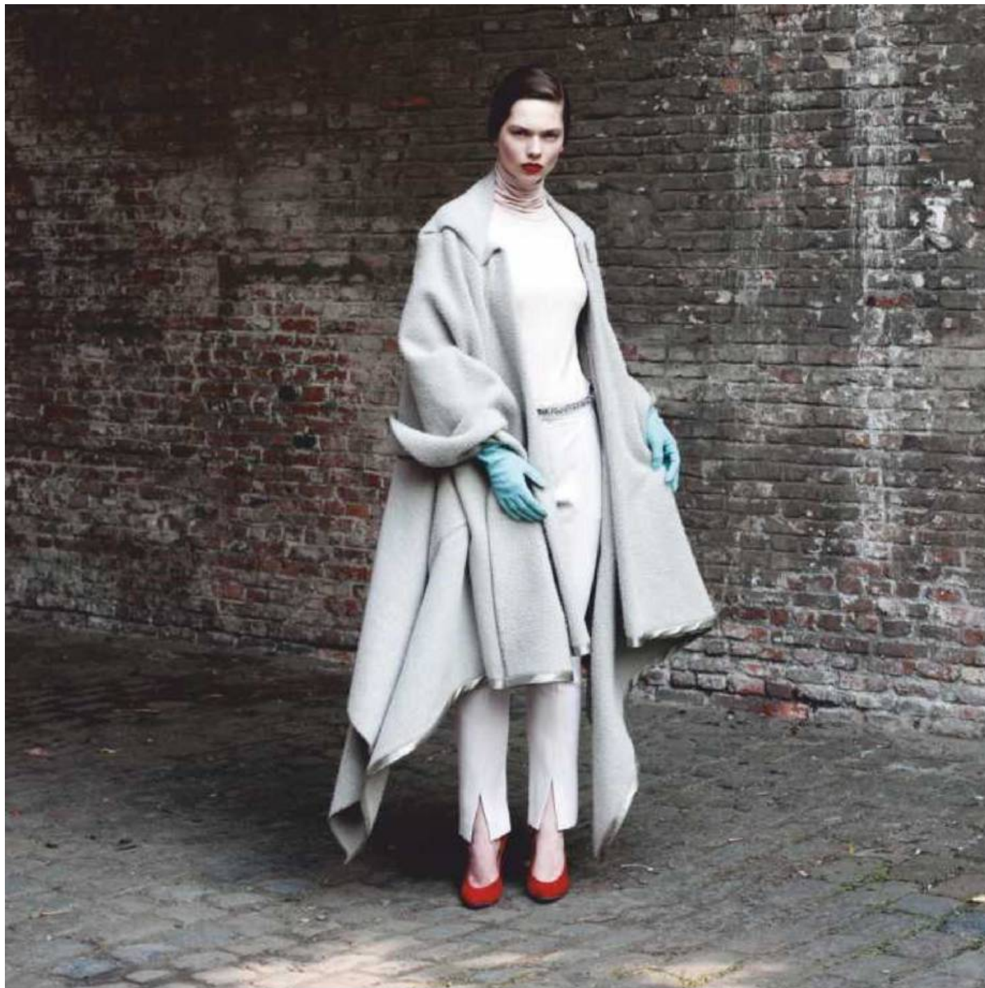
Sous-pull en jersey rose (Just in Case), pantalon beige en coton stretch (Filippa K), escarpins en daim rouge (Christian Louboutin), collier porté en ceinture (Essentiel), manteau-cape asymétrique (Maison Martin Margiela), gants en cuir bleu clair (Huis Boon).