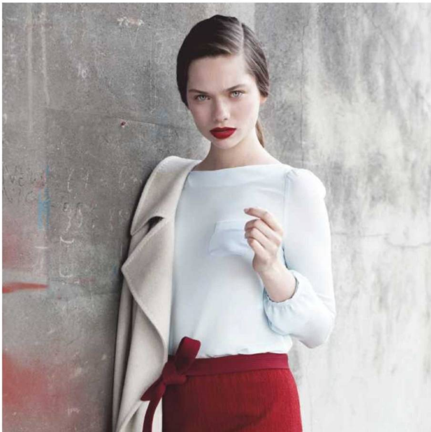
Blouse en mousseline de soie bleu pastel (Tara Jarmon), jupe rouge en stretch (Liola), ceinture (Class Cavalli), manteau écru en laine (MaxMara).