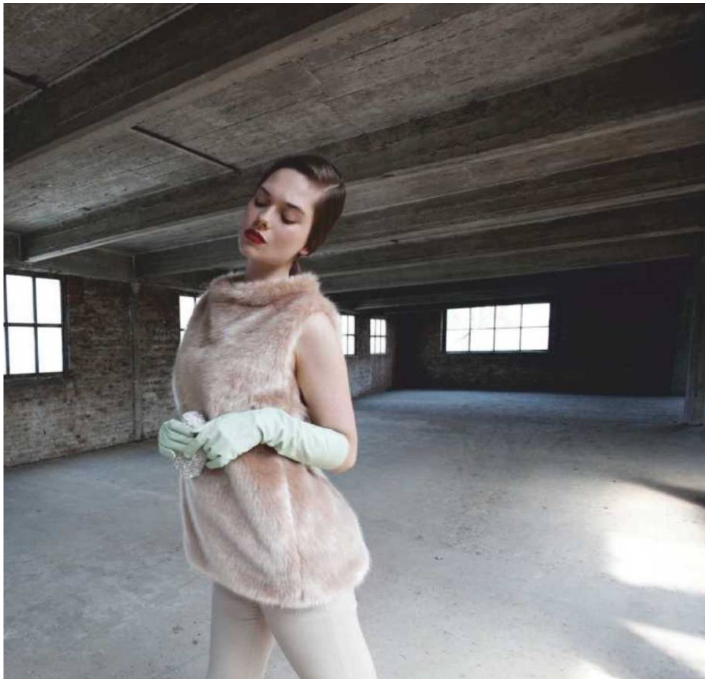
Top en fausse fourrure (L'Autre Chose), pantalon en laine écriue (Class Cavalli chez Verso), clutch en cristal (Swarovski), longs gants en cuir vert d'eau (COS).