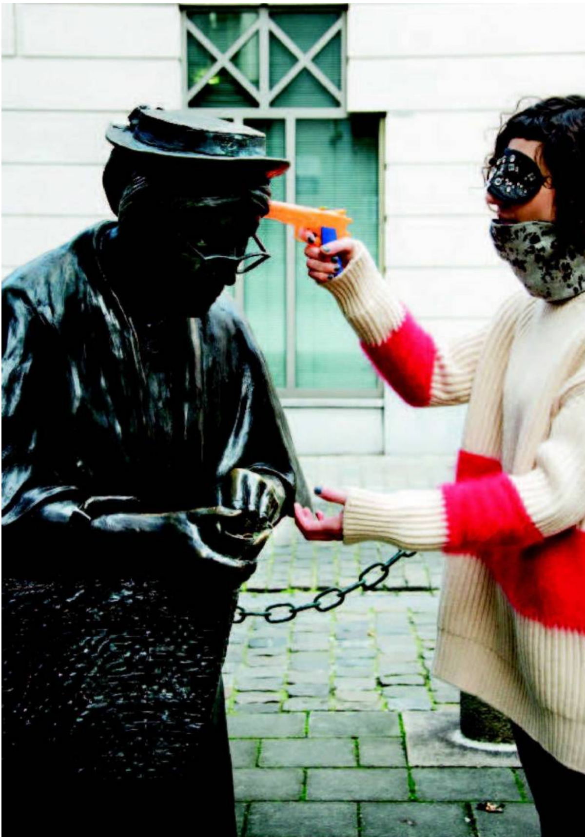
«MADAME CHAPEAU», TOM FRANTZEN, ANGLE DE LA RUE DU MIDI ET DE LA RUE DES MOINEAUX

Pull, Paule Ka, 580 €. Legging, American Vintage, 45 €. Loup, Olivia Hainaut, 165 €. Écharpe, Chauncey, 260 €.